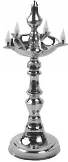
ગામ : મનફરા હાલે : અંધેરી